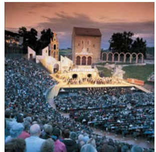
Avenches et Morat: Cités historiques Avenches und Murten: historische Städte

Ne manquez pas la cité médiévale de Morat et sa promenade au bord du lac très prisée, la petite ville d'Avenches établie il y